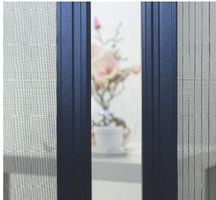
Gitter schnurgeführt, stabil und leicht zu bedienen.