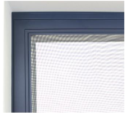
Stabile Ausführung mit schlanker Ansicht.