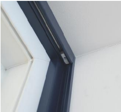
SoftClose-Schließmechanismus sorgt für ein geräuscharmes Schließen der Schiebetür.

Platzsparend bei großen Fensteröffnungen