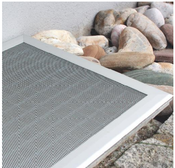
Einfache Montage auf vorhandenem Gitterrost. Die LSA ist witterungsbeständig und leicht zu reinigen. Sie ist aus formschönen, abgerundeten Aluminiumprofilen in silber eloxiert.

Das flache Bodenprofil vermeidet Stolperfallen und sorgt zusammen mit dem Edelstahl-Streckmetall-Gitter für eine hochwertige Optik. Durch den Einsatz von Klemmwinkeln können die Lichtschachtabdeckungen bei Bedarf sogar vor Ort noch angepasst werden. AL-IS Lichtschachtgitter sind auch für die Abdichtung von vertikalen Lüftungsschächten geeignet.