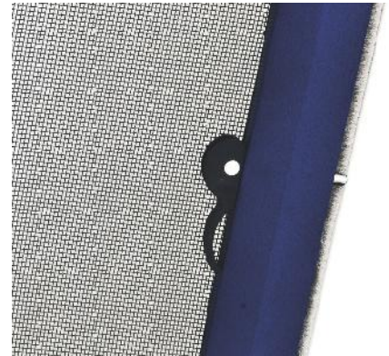
Befestigung mit Federstift.