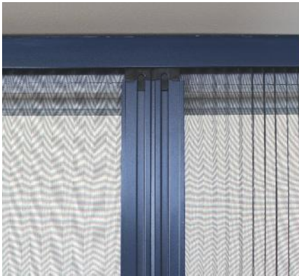
Im Profil integrierte Magnetzuhaltung.