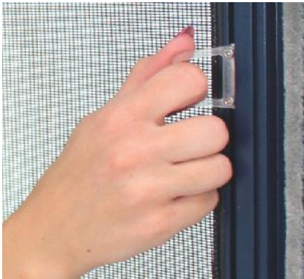
Transparente Griffflaschen zum leichten Montieren des Spannrahmens. Befestigung mit Haken.