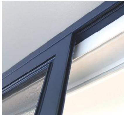
Oben gelagerte Schiebetüren können nahezu schwellenlos ausgeführt werden.